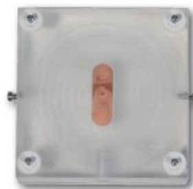
Objet test analogique